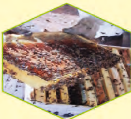
نحلة أيت باعمران